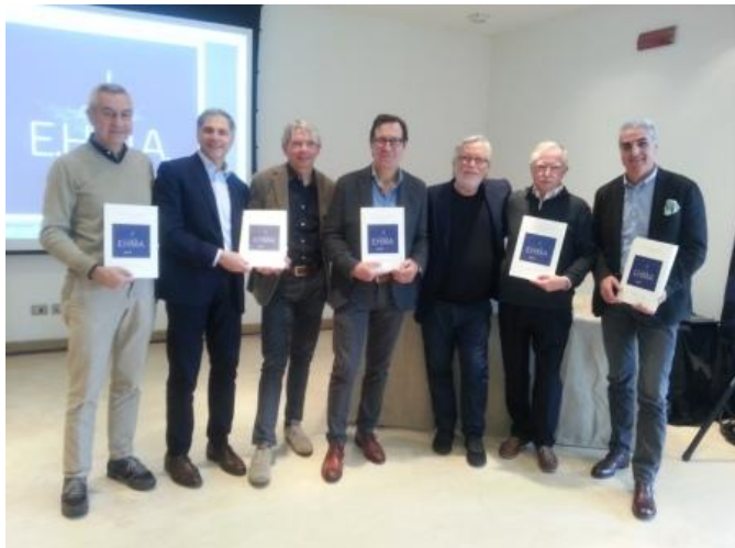
Comitato per le Innovazioni

L'INNOVAZIONE ED IL SOCIALE NEL FUTURO DELL'EHMA L'Italian Chapter dell'European Hotel Managers Association si è riunito al Verdura Resort di Sciacca per dibattere i temi del suo sviluppo.