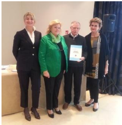
Comitato per il Sociale